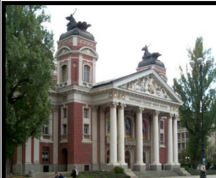
Teatro Ivan Vazov